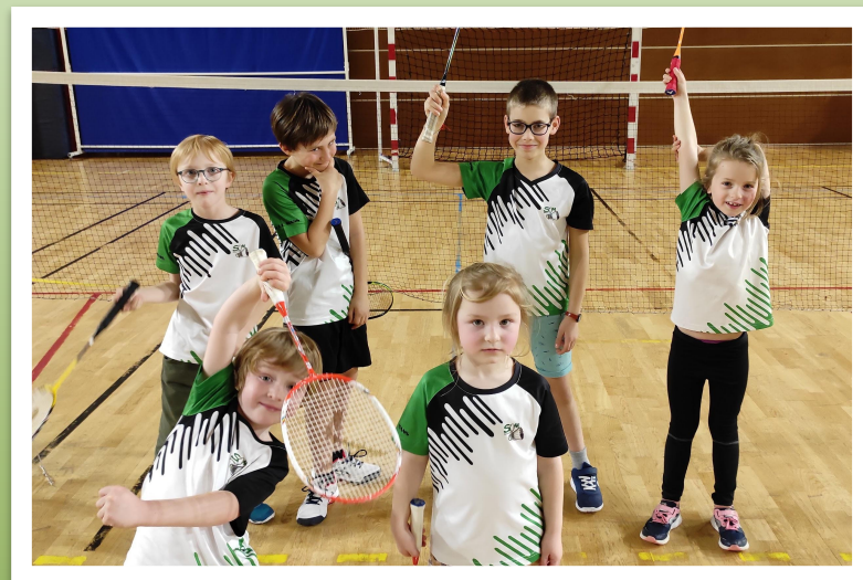
De nombreux jeunes dès 5 ans

De nombreux jeunes et leurs familles engagés sur les compétitions jeunes départementales et régionales avec de nombreux podiums.