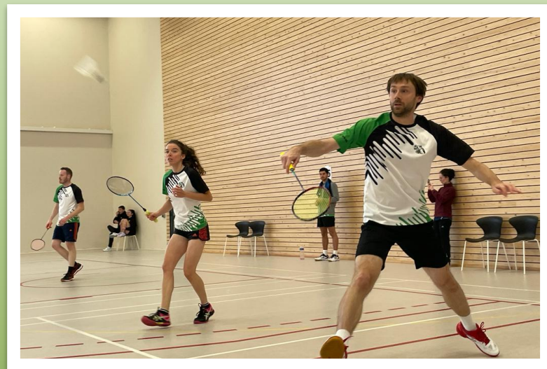
Une forte présence sur les tournois

10 titres dont ceux de champions de Sarthe 2024 et 2025 ces 2 dernières saisons.