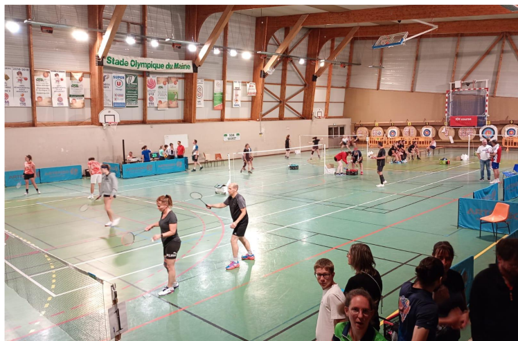
4 tournois organisés en 2024-2025

4 tournois organisés qui ont cumulés plus de 500 participants issus de 117 clubs de toute la France et des centaines de spectateurs en 2024-2025 !