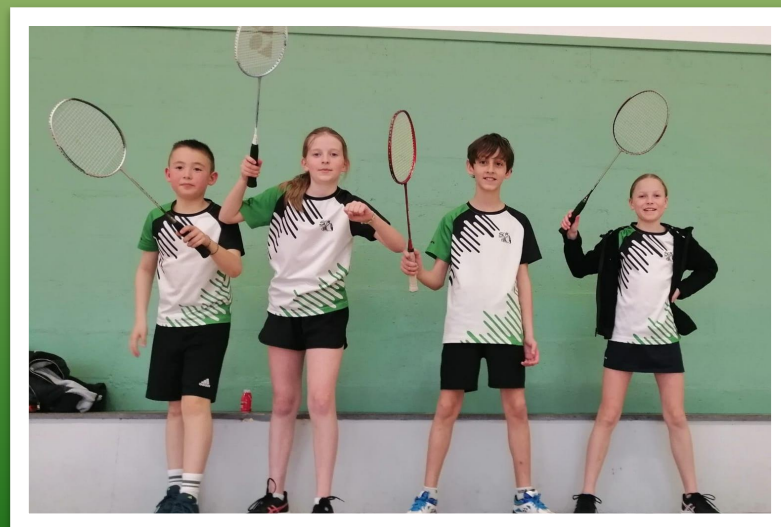
Champions de Sarthe benjamins