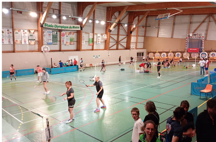
4 tournois organisés en 2024-2025

4 tournois organisés qui ont cumulés plus de 500 participants issus de 117 clubs de toute la France et des centaines de spectateurs en 2024-2025 !