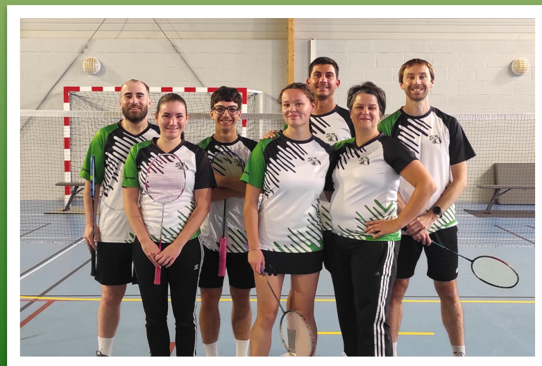
Champions de Sarthe 2024 et 2025